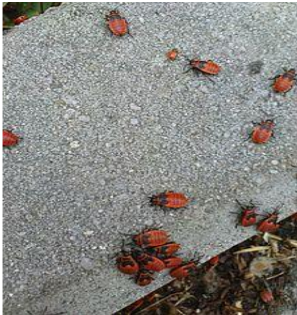
Ruměnice - nymfy

Je to hojně rozšířený druh plošnice. Dorůstá do délky okolo 1 cm. Živí se sáním semen rostlin, mrtvých živočichů nebo vajíček hmyzu. Její vysoce jasné zbarvení jí poskytuje ochranu před ptáky. Lidově se označuje „muzikant“ „maruška“, nebo „kněžíček“.